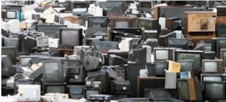
Gambar 2. Limbah Monitor TV dan Komputer