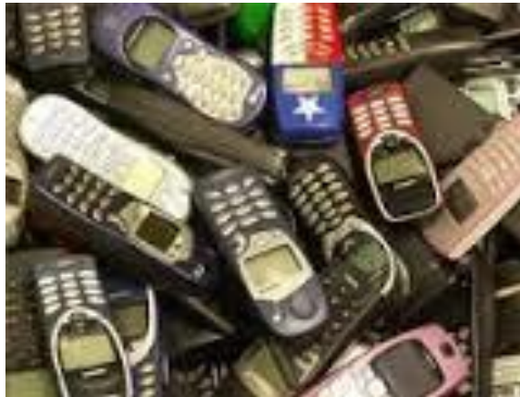
Gambar 3. Limbah Hand Phone