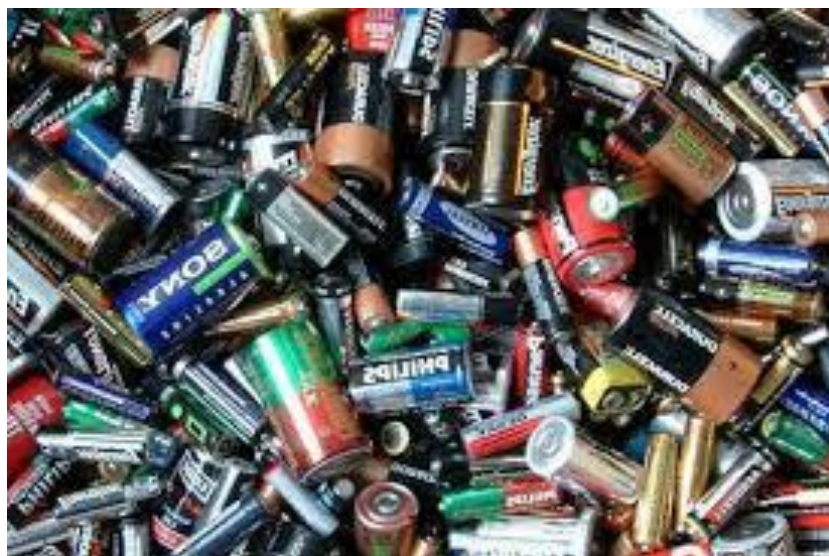
Gambar 1. Limbah Baterai