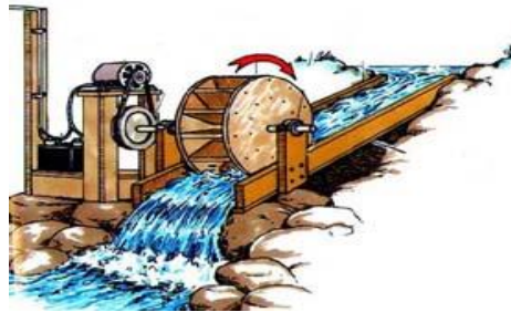
Gambar 2.1. PLTA dengan Kincir (Pembangkit Listrik Memanfaatkan Tenaga Air, 2020)